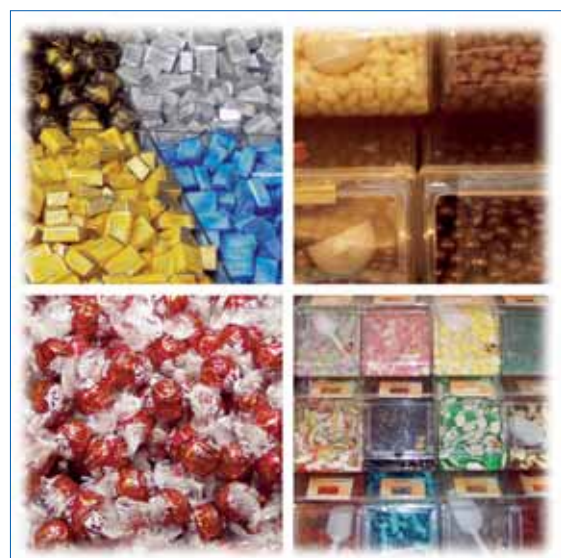
Abb. 3: Lebensmittel mit hohem Gehalt an fermentierbaren Zuckern

Die Bakterienflora im Biofilm ändert sich in Abhängigkeit von der Häufigkeit und der Menge der mit der Nahrung aufgenommenen Kohlenhydrate (Abb. 3). Je höher der Zuckerverbrauch, desto höher ist der Prozentsatz azidophiler und Säurebildender Bakterien [15]. Alle fermentierbaren Kohlenhydrate (Glukose, Saccharose, Fruktose etc.) können von den Bakterien zur Säurebildung verwendet werden [5]. Saccharose kann am einfachsten abgebaut werden, sie hat damit auch das höchste kariogene Potential. Glukose und Fruktose haben ein ähnlich hohes kariogenes Potential. Bei Galaktose und Laktose ist es etwa um das Zwanzigfache geringer. Liegt Saccharose in hoher Konzentration vor, so können neben Säuren auch Glucane entstehen. Diese hoch adhäsiven Moleküle unterstützen die Anhaftung von Streptokokkus mutans an der Zahnoberfläche. Komplexere Kohlenhydrate wie ungekochte Stärke können von den Bakterien nicht verstoffwechselt werden und sind daher nicht kariogen.