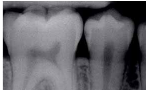
Abb. 5: Entmineralisierung des Schmelzes

Die ersten Stadien der Entmineralisierung des Schmelzes sind schwer zu diagnostizieren. Der erste erkennbare Schaden, der bei der Entmineralisierung des Zahnes entsteht, wird als White Spot (weißer Schmelzfleck) bezeichnet. Dabei handelt es sich um eine kleine entmineralisierte Zone unter der mit Biofilm überzogenen Schmelzoberfläche. Ein White Spot kann anfänglich nur erkannt werden, wenn der darüber liegende Biofilm entfernt und die Zahnoberfläche getrocknet wird. Die weißliche Farbe entsteht, da der Brechungsindex der entkalkten Zone im Vergleich zu dem angrenzenden, transluzenten Schmelz verändert ist. Der beschädigte Bereich ist unter der scheinbar intakten Schmelzoberfläche erkennbar. Der Schmelz hat dort etwa 50 Prozent seines ursprünglichen Mineralgehaltes verloren (Abb. 6).