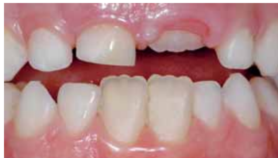
Abb. 4: Phase des Zahndurchbruchs. Die Schmelzoberfläche unterliegt einem Reifungsprozess.

Das Phänomen der posteruptiven Reifung ist nicht nur typisch für den Schmelz. Sie findet an jedem mineralisierten Gewebe statt, das dem oralen Milieu ausgesetzt ist, also auch an freiliegendem Zement oder Dentin der Zahnwurzel. Wird die Wurzeloberfläche dem oralen Umfeld ausgesetzt, ändert sich die mineralische Zusammensetzung der exponierten Hartsubstanz. So findet man an der Oberfläche von frei liegendem Wurzelzement größere Apatitkristalle [19]. Bei dieser langsamen Exposition der Wurzeln spielt auch die Entzündung des Zahnfleisches eine