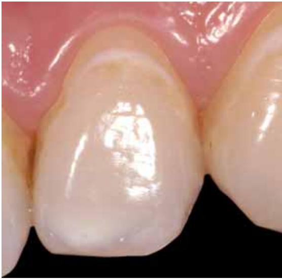
Abb. 6: Als White Spot erkennbare Entmineralisierung an der Zahnoberfläche

breitende Reaktion an der Schmelz-Dentin-Grenze. Die Reaktion des Dentins wird durch Reize, die von der weniger weit fortgeschrittenen kariösen Läsion des Schmelzes entlang der Schmelzprismen übertragen werden, ausgelöst. Sowohl die Schädigung des Dentins als auch die des Schmelzes werden durch den Biofilm auf der Zahnoberfläche hervorgerufen beziehungsweise gesteuert. Entfernt man diesen, wird das Fortschreiten der Läsion verhindert [24]. Die Entmineralisierung des Gewebes erfolgt vor der bakteriellen Infektion, so dass eine Entmineralisierung nicht notwendigerweise eine Infektion nach sich zieht [16]. Erst wenn der Schmelzdefekt die Schmelz-Dentin-Grenze erreicht hat, kommt es dort zu einer bakteriellen Infektion. Die Karies schreitet im Manteldentin nach lateral fort und unterminiert den Schmelz, gleichzeitig entwickelt sie sich weiter in die Tiefe [27]. Die Progression der Karies im Dentin erfolgt in zwei Phasen. Auf die Entmineralisierung folgt die Auflösung der organischen Matrix. Während die Entmineralisierung direkt mit der Wirkung der erzeugten Säuren zusammenhängt, wird die proteolytische Phase der Auflösung des organischen Netzwerkes zum Teil durch Phänomene bedingt, die mit dem chemisch-physikalischen Zusammenbruch des Gewebes zusammenhängen.