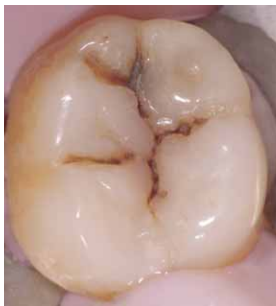
Abb. 2a bis c: Verschiedene Formen kariöser Läsionen

Obwohl kariogene Keime von Mensch zu Mensch übertragbar sind, gilt Karies als eine multifaktorielle Erkrankung. Die Zusammensetzung des oralen Biofilms und seine metabolische Aktivität stehen in einer komplexen Wechselbeziehung mit verschiedenen Faktoren wie Zusammensetzung und Fließrate des Speichels, Ernährung, lokale Immunabwehr der Mundhöhle sowie pH-Wert und Menge von Fluoriden in Biofilm, Speichel oder Sulkusflüssigkeit. Das Zusammenwirken all dieser Faktoren bestimmt letztendlich die Wahrscheinlichkeit und die Geschwindigkeit eines Mineralverlustes aus der Zahnhartsubstanz [1]. Neben diesen primären Faktoren sind zahlreiche sekundäre und tertiäre Faktoren so-