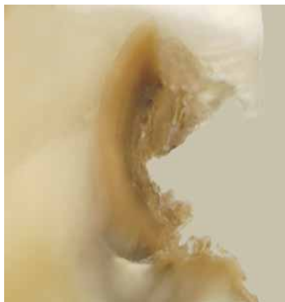
Abb. 7a und b: Fortgeschrittene Dentinkaries und histologischer Querschnitt mit erkennbar verschiedenen Schichten

verlust findet hierbei an der Zahnoberfläche statt, die Schädigung schreitet in das Gewebeinnere fort. An der Oberfläche erfolgt keine Remineralisierung, das heißt die Entmineralisierung vollzieht sich nicht wie bei der Karies primär unterhalb der Oberfläche. Die bakterielle Metabolisierung von Zuckern zu Säuren im Biofilm läuft sehr schnell ab. Der pH-Wert des Biofilms sinkt schon fünf bis sieben Minuten nach dem Verzehr von Zucker ab. Die Neutralisation der produzierten Säure durch den Speichel erfolgt langsamer. Wie man an der sogenannten Stephankurve sehen kann, wird erst nach etwa 45 Minuten ein für den Schmelz unkritischer pH-Wert erreicht. Die Stephankurve kann dazu verwendet werden, dem Patienten den Einfluss der bakteriell erzeugten Säuren auf der Zahnoberfläche zu erklären. Es ist wichtig, dass der Patient den schädigenden Einfluss zuckerhaltiger Zwischenmahlzeiten sowie die Not-